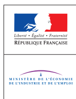
TABLEAU DE BORD DE L'ATTRACTIVITÉ DE LA FRANCE 2010

Ministère de l'Économie, de l'Industrie et de l'Emploi Direction générale du trésor 139 rue de Bercy 75572 Paris cedex 12 Tél. 01 40 04 04 04 www.minefe.gouv.fr