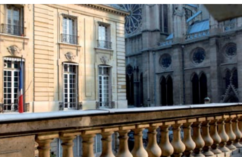
Le Centre d'analyse stratégique

Une équipe permanente d'experts, des conseillers scientifiques issus du monde de la recherche.