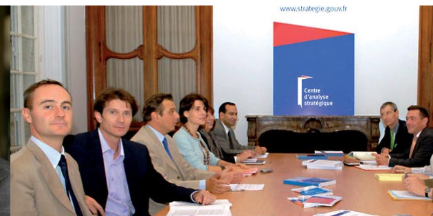
Comité de direction